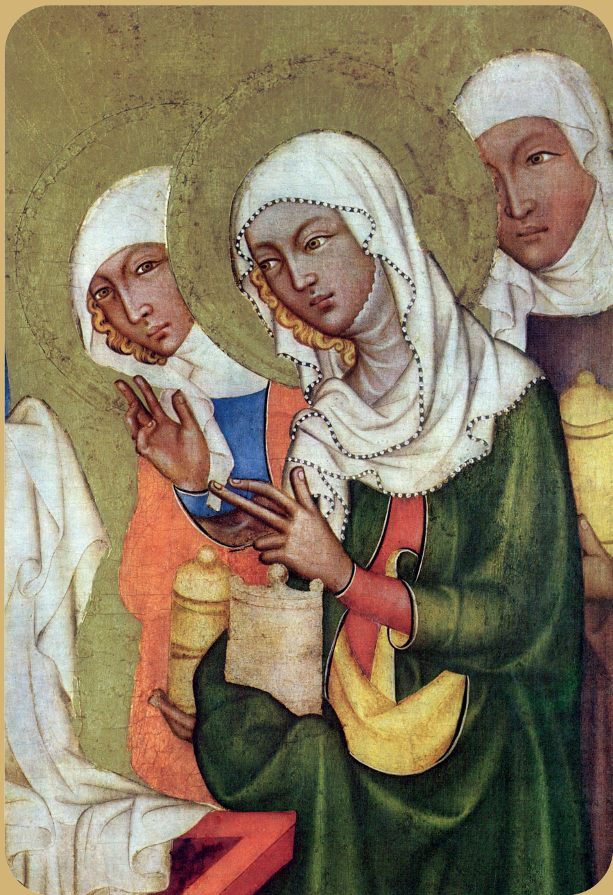
Meister von Hohenfurth, De drie Maria's bij het graf (detail).